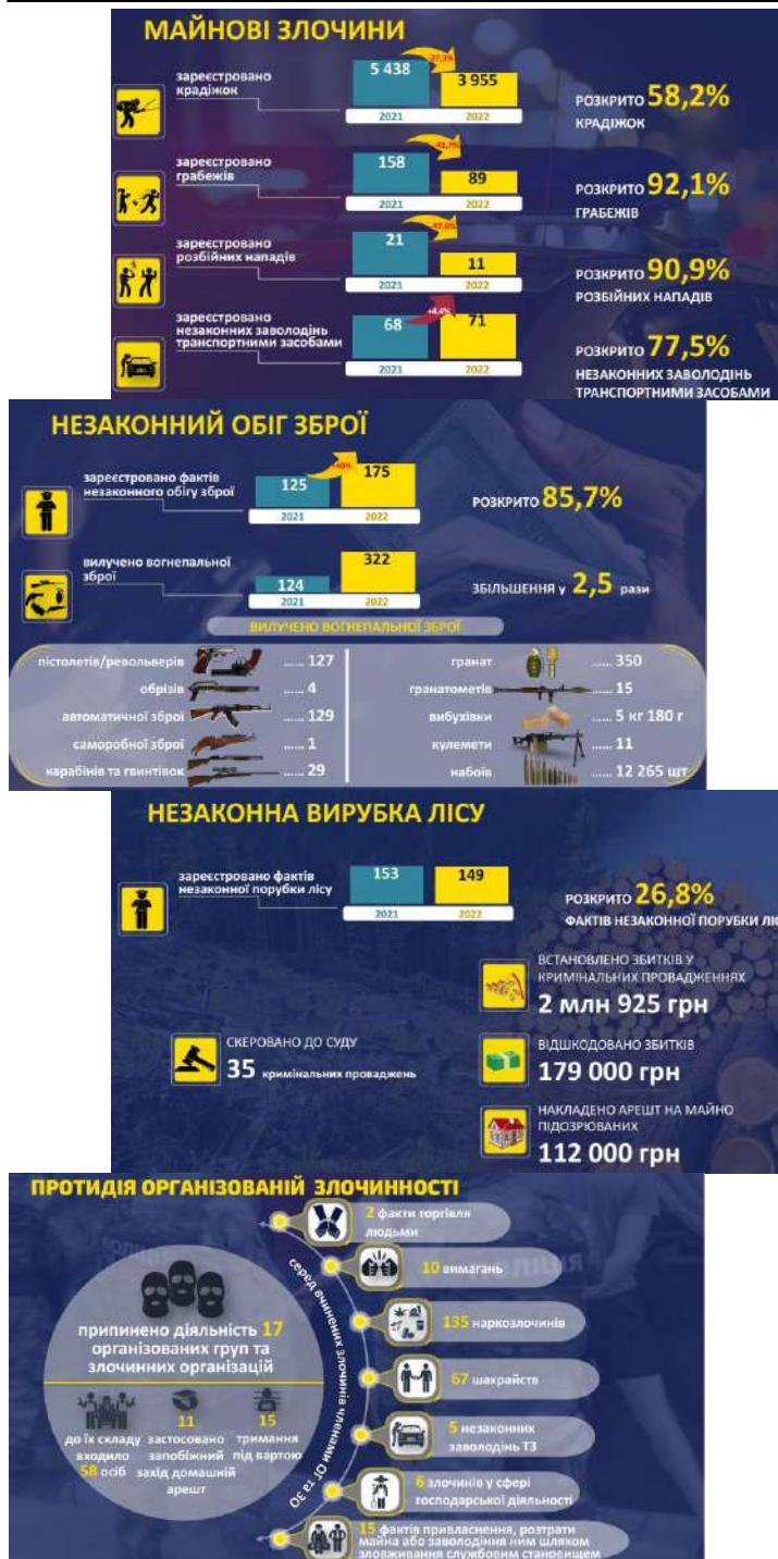
Рис.3. Деякі фактичні показники виконання програми

У роботі розглянуті елементи регіональної програми системи охорони правопорядку, її світоглядна концепція та потенціал реалізації. Оpubліковані тези є