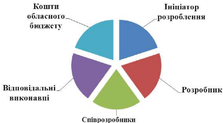
Рис.1. Основні учасники та фінансування програми

На рис.1 схематично показані основні учасники та фінансування програми.