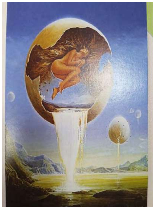
Рис. 9 - Мої намагання

відкриватись людям, це пов'язано з тим, що я боюсь неприйняття, а мені дуже важливо щоб мене любили, приймали, підтримували. І тому люди не знають яка я. не всі, точніше мало хто. І, на мою думку, мене бачать так.