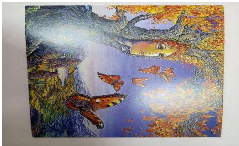
Рис. 6 - Самотність

Обґрунтування респондента: мій вибір супроводжувався такими емоціями як: надія, сподівання, очікування. Ця картина, на якій зображено двірну щілину, в якій видно красу. Для мене вона відображає те, що після поганого минулого йде щасливе майбутнє. Це підкреслює сенс моїх дій, мого існування.