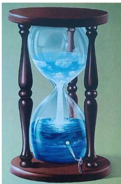
Рис. 3 - Моя мрія

картина підказка, що потрібно цінити та оберігати своїх жінок. Жінки – квіти за якими потрібно доглядати.