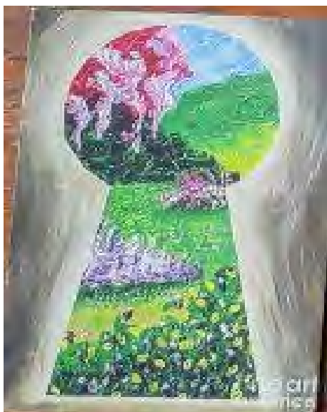
Рис - 5 Моє минуле

Обґрунтування респондента: мій вибір супроводжувався такими емоціями як: надія, сподівання, очікування. Ця картина, на якій зображено двірну щілину, в якій видно красу. Для мене вона відображає те, що після поганого минулого йде щасливе майбутнє. Це підкреслює сенс моїх дій, мого існування.