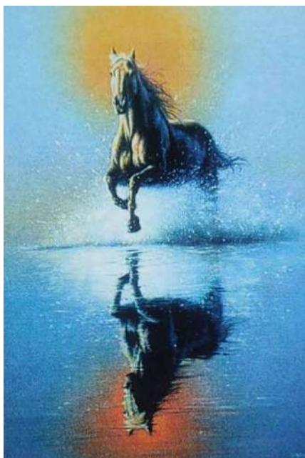
Рис. 1 - Моє майбутнє

Обґрунтування респондента: мій вибір супроводжувався такими емоціями як: впевненість та спокій. На картинці для мене відображено рух життя, його сенс, що потрібно спокійно дивитися в майбутнє та оцінювати свої можливості. Мати гармонію у своєму житті.