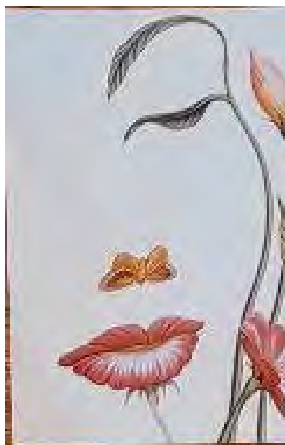
Рис. 2 - Людина, яку я люблю

Обґрунтування респондента: мій вибір супроводжувався такими емоціями як: впевненість та спокій. На картинці для мене відображено рух життя, його сенс, що потрібно спокійно дивитися в майбутнє та оцінювати свої можливості. Мати гармонію у своєму житті.