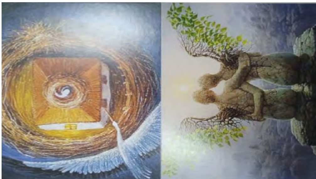
Рис. 11 - Ідеальна сім'я

Обґрунтування респондента: такою людиною для мене є вітчим. Він воював, що вже викликає повагу. Добре ставиться до мами і нас. У мене до нього відчуття поваги і любові. Я знаю, що він підтримає і допоможе, якщо буде потрібно.