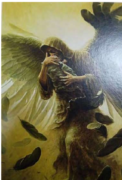
Рис. 10 - Людина, яку я поважаю

Обґрунтування респондента: це я намагаюсь відкриватись людям, відчуваю себе вразливою і не комфортно.