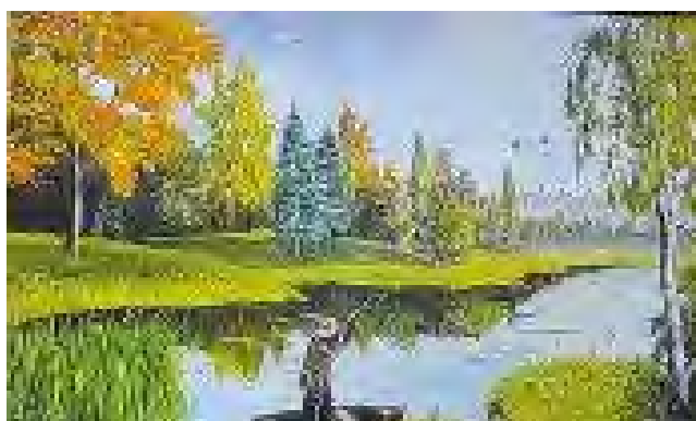
Рис. 4 - Мій звичайний емоційний стан

Обґрунтування респондента: мій вибір супроводжувався такими емоціями як: спокій та очікування. На картинці для мене зображено час, в образі спокійного та великого океану. Мрії здійснюються так само спокійно та довго, як плине час. Бо завжди, щоб досягти своїх цілей – потрібен час.