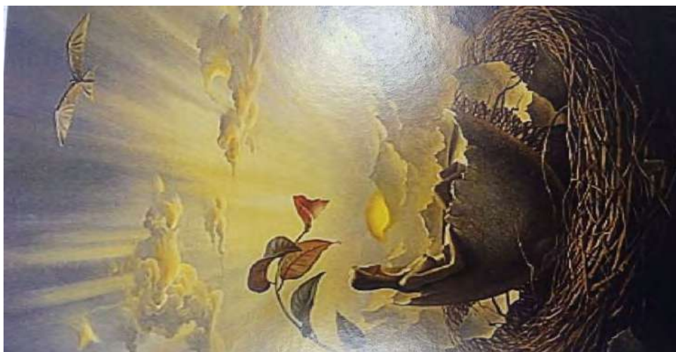
Рис. 7 - Мої бажання, мої можливості

Обґрунтування респондента: на цьому малюнку, схід сонця і ранок символізують для мене мої можливості і бажання, але я сиджу в гніздечку, дивлюсь на них збоку і не хочу виходити із зони комфорту, оскільки боюсь зробити помилку, несприйняття, осуду. Мені подобається ця картинка, в ній є щось добре і спокійне, з життєвим сенсом. Відчуття наче зійде сонце, дівчинка встане й почне робити свої справи, а зараз вона просто відпочиває і налаштовується.