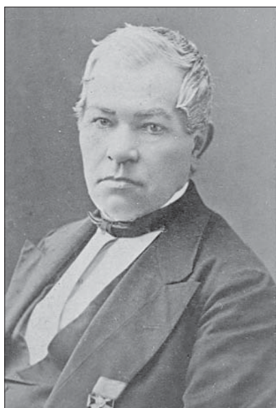
Степан Павлович Стеблін-Камінський. Фото 1860-х рр.

Перевороту, зневажливе ставлення до шляхетного походження в радянські часи сформували в суспільстві викривлене сприйняття історії. Насправді в Російській імперії (куди входила й частина України) дворянство упродовж століть відіграло провідну роль, адже переважна частина офіцерів, чиновників, дипломатів була саме дворянського походження. Від низів і до вершини імператорської влади, від гарнізонного капітана й до генерал-фельдмаршала, від колезького реєстратора до канцлера імперії дворяни своїми повсякденними справами, відданою службою зміцнювали державу й визначали її внутрішню та зовнішню політику. Основними рисами, які прищеплювалися дітям у шляхетних родинах, були державність, чесність, любов до батьківщини й бажання безкорисливо щось робити для свого народу. Звичайно, серед представників заможних родів траплялися й гультяї, п'яниці, самодури. Та все ж переважна більшість дворян прославляли Вітчизну доблестю в битвах і звитязними справами в мирний час.