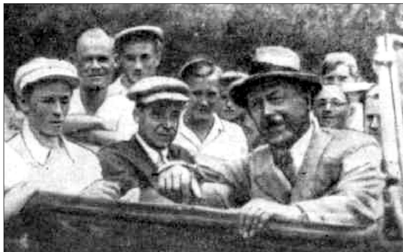
Сухумі. 1-й зліва В.Ф.Ніколаєв; 3-й М.І.Вавилов (1930-ті)

У 1926р. – лаборант української станції Всесоюзного інституту рослинництва.