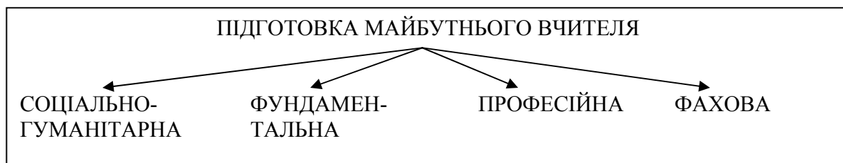
Рис. 2. Властивості підготовки майбутнього вчителя.

Аналізуючи поняття “професійна підготовка”, необхідно визначитися зі змістом понять “властивість”, “особливість” і “якість”. У визначенні термінологічних можливостей частин мови вважається, що основний склад термінологічного списку європейських мов може бути вичерпаний іменниками, оскільки мовним найменуванням у галузі термінології може бути лише номінативна конструкція, ядром якої є іменник [1, с. 11; 4, с. 119; 5, с. 37; 7, с. 135]. Тому, властивості К.К.Платонов визначає як прикметники до того, що позначають як іменник [10, с. 58]. Наприклад, освітня підготовка сучасного вчителя складається із соціально-гуманітарної, фундаментальної, професійної та фахової підготовки (Рис. 2).