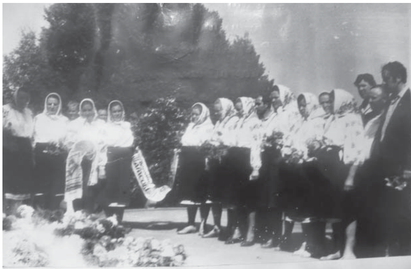
Учасники жіночого етнографічного ансамблю «Діброва» із села Тарнавшини Лубенського району Полтавської області на Шевченковій могилі. Фото. 1983 р.

району. Під звуки Шевченкового «Заповіту» піднялися вони на Кобзареву могилу, поклали вінок, сплетений із барвінку та калини. Потім у їхньому виконанні прозвучало кілька пісень на