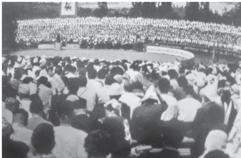
Учасники зведеного українського хору (2500 осіб) виконують «Заповіт» Т. Г. Шевченка. Фото. 22 травня 1964 р.

О 13 годині на Тарасову гору прибули державні і партійні діячі, письменники, художники з усіх братніх республік Радянського Союзу... Тисячі людей заповнили круті дніпровські схили... Лунає урочиста мелодія «Заповіту»... Покладаються вінки і квіти на Шевченкову могилу... Потім гості прямують до музею, де знайомляться з експозицією... До книги вражень роблять записи, а в дарунок музею лишають скромні дарунки... Цього дня на Тарасовій горі та в музеї побувало 5 тисяч Кобзаревих шанувальників».