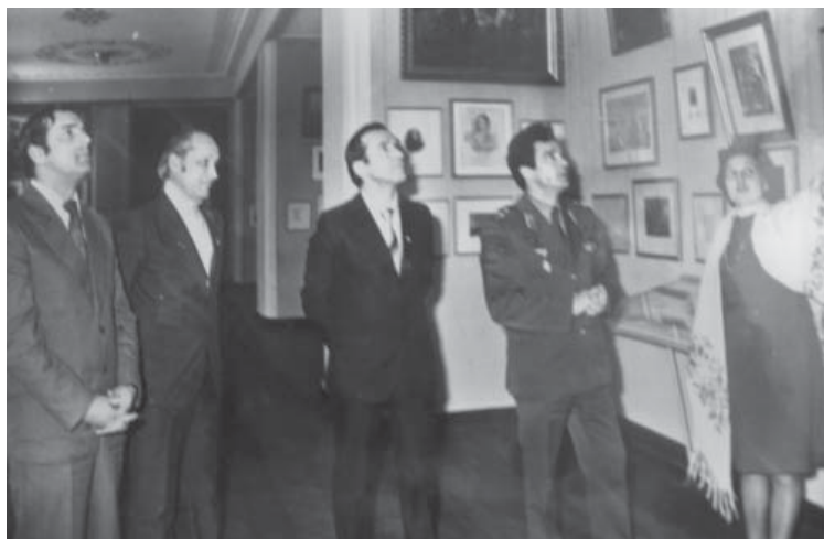
Льотчик-космонавт СРСР, Герой Радянського Союзу В. Д. Зудов знайомиться з експозицією музею Кобзаря в Каневі. Фото. 1983 р.

Гортаючи сторінки «Літопису» за 1978 рік, можна довідатися, що того року на Тарасовій горі побували лауреати Шевченківської премії: український композитор К. Ф. Данькевич, український письменник О. Т. Гончар; учасники Декади молдавської літератури в Україні, народний артист СРСР, лауреат Державної премії СРСР І. С. Козловський.