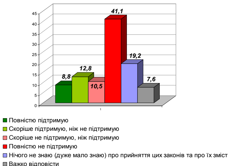
Рис. 1. Розподіл відповідей на запитання «Як Ви ставитесь до прийняття Верховною Радою України 16 січня 2014 р. пакета законів, які посилюють відповідальність за окремі правопорушення, посилюють захист суддів та представників правоохоронних органів, та низки інших законів?», % від кількості респондентів, які відповіли на запитання

Основні маркери етапу: 19 січня – віче на Майдані незалежності; збройне протистояння між силовиками та Євромайданівцями на вул. Грушевського; бойові дії; перші вбиті; «Небесна сотня». У лютому 2014 року відбулося фактично «друге народження незалежності України», «коли сотня найкращих українських хлопців і дівчат незалежно від того, якої вони були національності й громадянами якої країни вони були, віддали своє життя для того, щоб народилася нова країна та новий народ» [2].