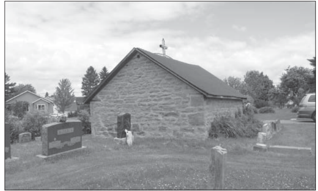
Скелп Джона Маккомбера (Івана Даценка)

У поліційному відділку нам не тільки розповіли про родину Джона Маккомбера, а навіть подарували карту резервації, на якій указали, де знаходиться магазин, що належить онукові Джона – Томасові Маккомберові, та де знаходиться музей і цвинтар.