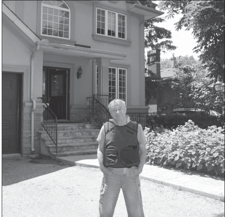
Примірка бронежилета перед поверненням в Україну

Знову про спиртне. Торгівля ним є монополією держави. Тому ціни скрізь однакові. Ма-