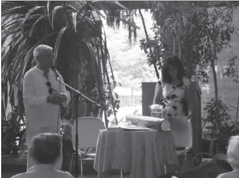
Виступ із презентацією в старечому будинку імені Івана Франка