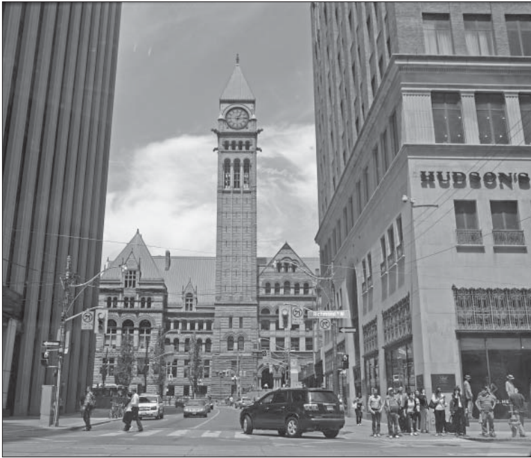
На вулицях Торонто

Маю 3 години вільного часу. Вирішив знову відвідати Онтаріо, але попередньо завітав до магазину і взяв дві банки пива. Вирішив на