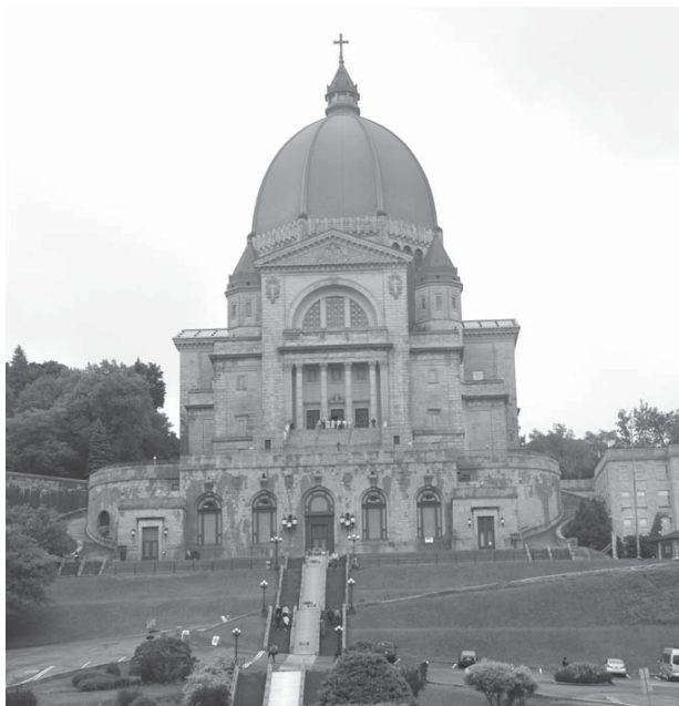
Собор Святого Йосипа в Монреалі

«Добрий день, пане генерале Чупринка (одне із псевдо Шухевича). Слава Україні!» На це актор