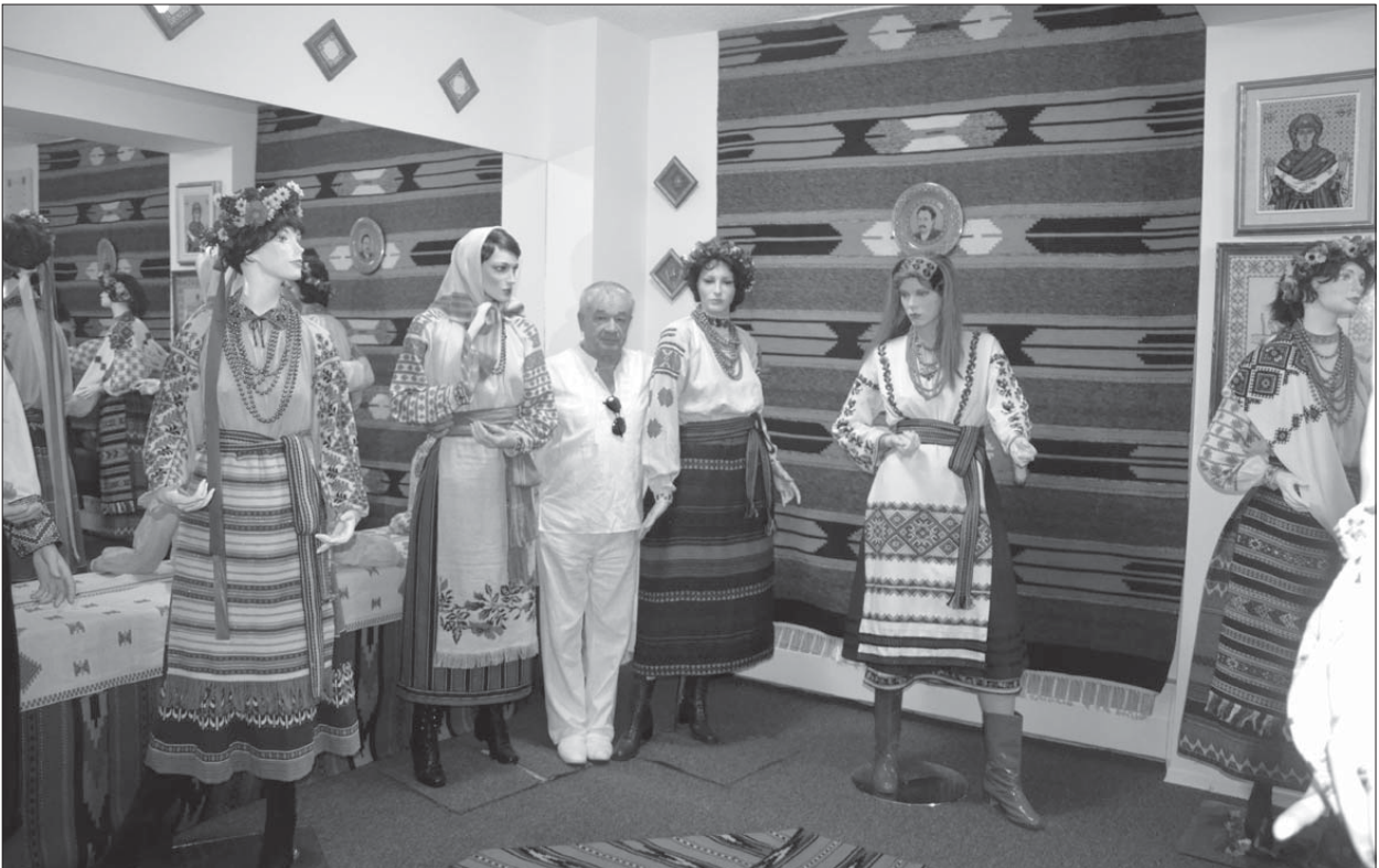
Український етнографічний музей у старечому будинку імені Івана Франка