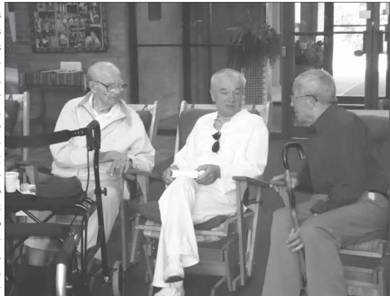
Усесвітньо відомий актор Михайло Лялька (ліворуч)

У будинку І. Франка є чудовий етнографічний український музей. Саме слова «чудовий музей» я вжив, залишаючи запис у книзі відвідувачів.