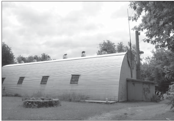
Споруда колишнього музею ірокезів на території резервації

зин, який продавав справжні індіанські вироби, правда, за захмарними цінами, а магазинчиків,