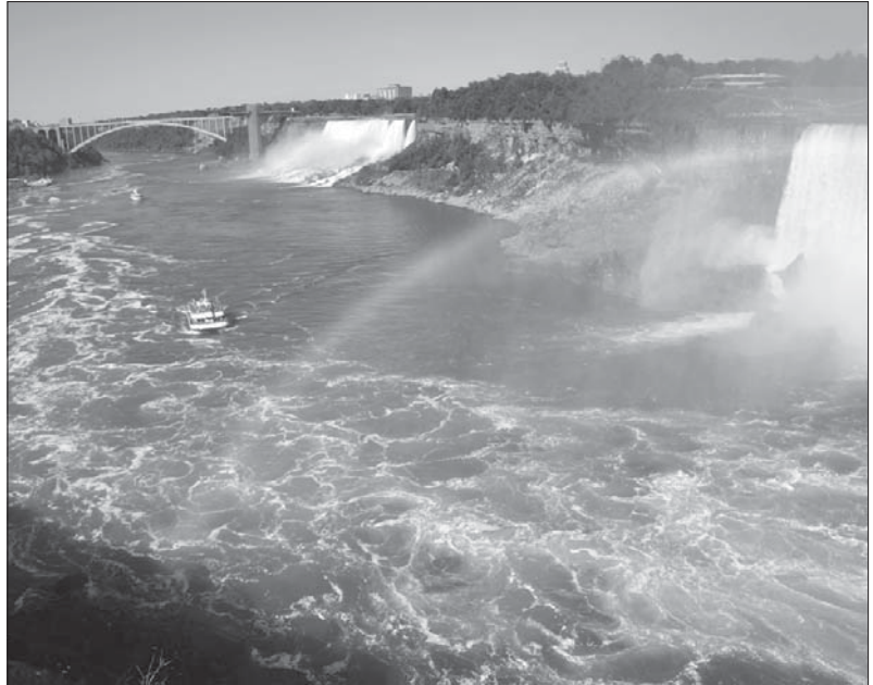
Ніагарський водоспад, вид із Канади на США

учасник київського Майдану. Навіть утратив там свого зуба. Через свою активну проукраїнську позицію мав неприємності з канадською