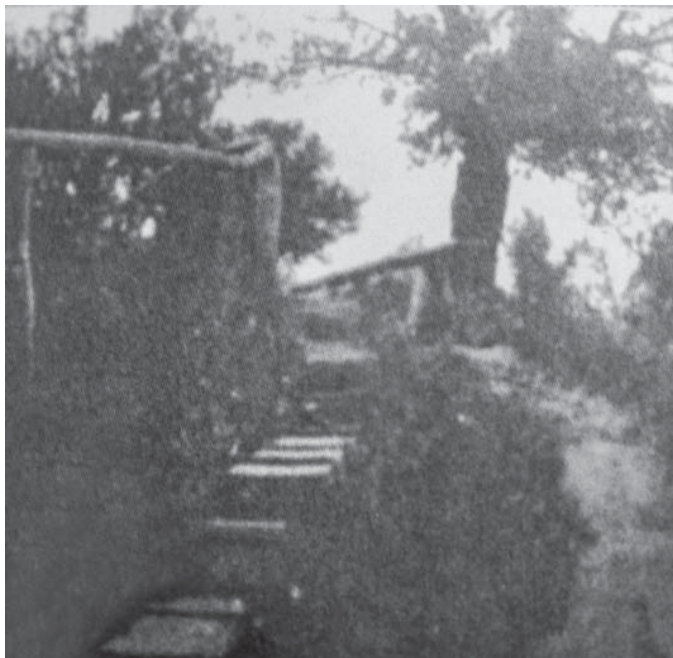
Перші дерев'яні сходи на Тарасову гору. Фото Н. Х. Онацького, 1911 р.

Надія Василівна розповідала, що саме тоді Никанор Харитонович уславився як художник. Тож природно, що і в Каневі 1911 року він багато малює – творить ескізи до майбутніх картин. Повернувшись у Лебедин (де тоді проживав із сім'єю), створює цілу тематичну серію: «Шевченкова могила», «Під горою Канів», «Канівський краєвид», «Канів. Могила Т. Шевченка», «Хата біля Тарасової гори». Останній із названих творів згодом активно тиражувався на поштових листівках