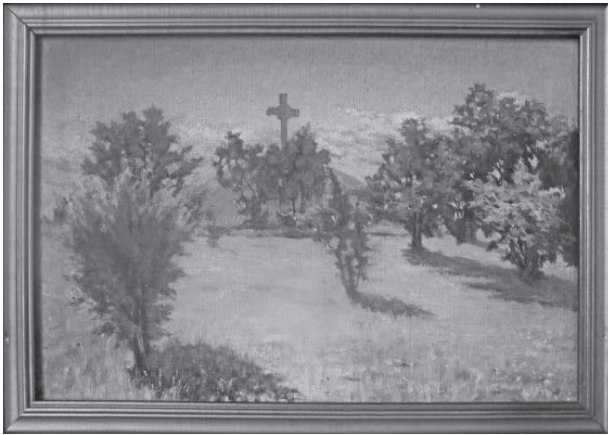
Н. Х. Онацький. Могила Т. Г. Шевченка. Полотно, олія, 1911 р.

Митець показує не тільки могилу улюбленого поета, а й місце, яке її оточує. І це прикмета фактично всіх робіт художника про останнє пристанище Кобзаря.