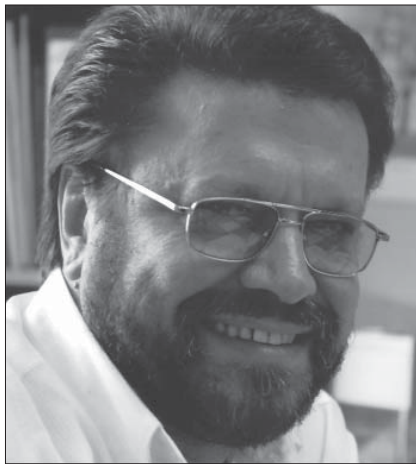
Художник і архітектор Анатолій Чернощоків. Фото

цей період брав участь у створенні експозицій – Музею театру і кіно (Київ), Музею О. В. Суворова (Очаків), Музею-садиби І. П. Котляревського (Полтава).