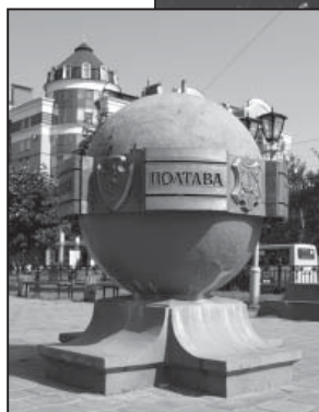
Пам'ятний знак 1100-ліття Полтави