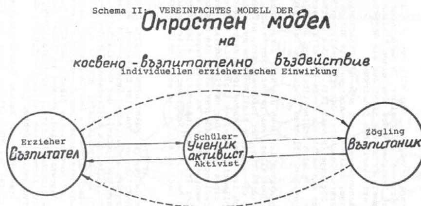
Рис. 2: Схема воспитательного воздействия по Чайковой

ским исследователем Н. Чайковой. Название статьи уже само по себе интересное: «Педагогическая система Макаренко как подсистема советского общества» [4, с. 159]