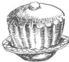
Різдвяний хліб («васильчик»)

На С. в. було прийнято вшановувати померлих і живих родичів. Для перших залишали рештки їжі на столі (мити посуд у цей день вважалося за гріх). До живих посилали дітей зі святковими стравами. Приймаючи їх, господарі дякували і теж передавали такі самі страви зі свого столу. Це символізувало спорідненість сімей, їхню приязнь і взаємну щедрість. Дітей, які приносили вечерю, частували, обдаровували гостинцями.