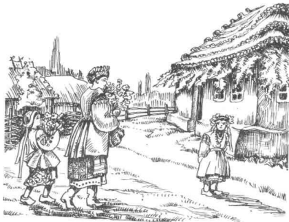
Напередодні Зелених свят

На Зелені свята, як і після Великодня, провідували померлих родичів, могили яких обсіпали клечаним зіллям. На кладовищі влаштовували панахиди та спільні поминальні трапези. Ця традиція подекуди збереглася до наших днів.