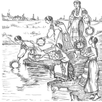
Занурення вінків на Купала

Купальську ніч вважали чарівною, коли пробуджувалася нечиста сила. Звідси — широко розповсюджені дівочі ворожіння на вінках, численні обряди і магічні прийоми, за допомогою яких застерігались від відьом. Вірили, що трави, зібрані на К. , мають особливо цілющі властивості. Багато повір'їв було пов'язано з квіткою папороті.