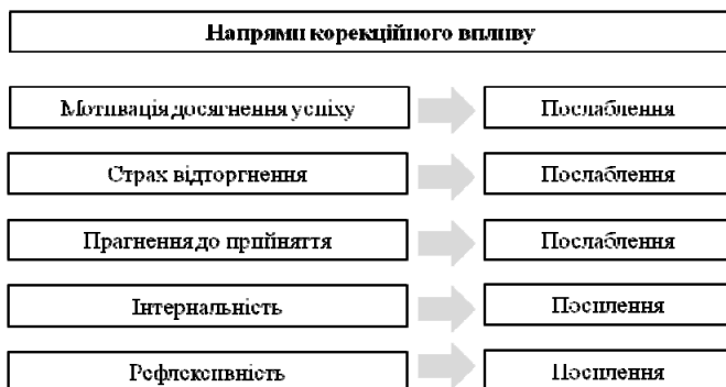
Рис. 1. Напрями корекції соціально-психологічних особливостей стилю споживання матеріальних благ особами з низьким економічним статусом

Слід зазначити, що не всі перераховані вище негативні прояви соціально-психологічних особливостей стилю споживання матеріальних благ властиві особам, що мають низький економічний статус, що певним чином ускладнює створення єдиної корекційної програми для носіїв низького економічного статусу. Крім того, ми вважаємо, що не всі негативні прояви соціально-психологічних особливостей стилю споживання матеріальних благ здатні піддатись корекції в рамках невеликої серії корекційних занять, адже для їхнього подолання потрібна більш глибока як тренінгова, так і психотерапевтична робота. До таких особливостей належать, зокрема, ціннісні компоненти, а також локус контролю, який є базовою психологічною настановою особистості щодо привласнення або відчуження відповідальності за власне життя. Тому ми сфокусувались на обґрунтуванні можливостей корекційного впливу, не прагнучі досягти корекції всіх означених негативних проявів соціально-психологічних особливостей стилю споживання матеріальних благ особами з низьким економічним статусом.