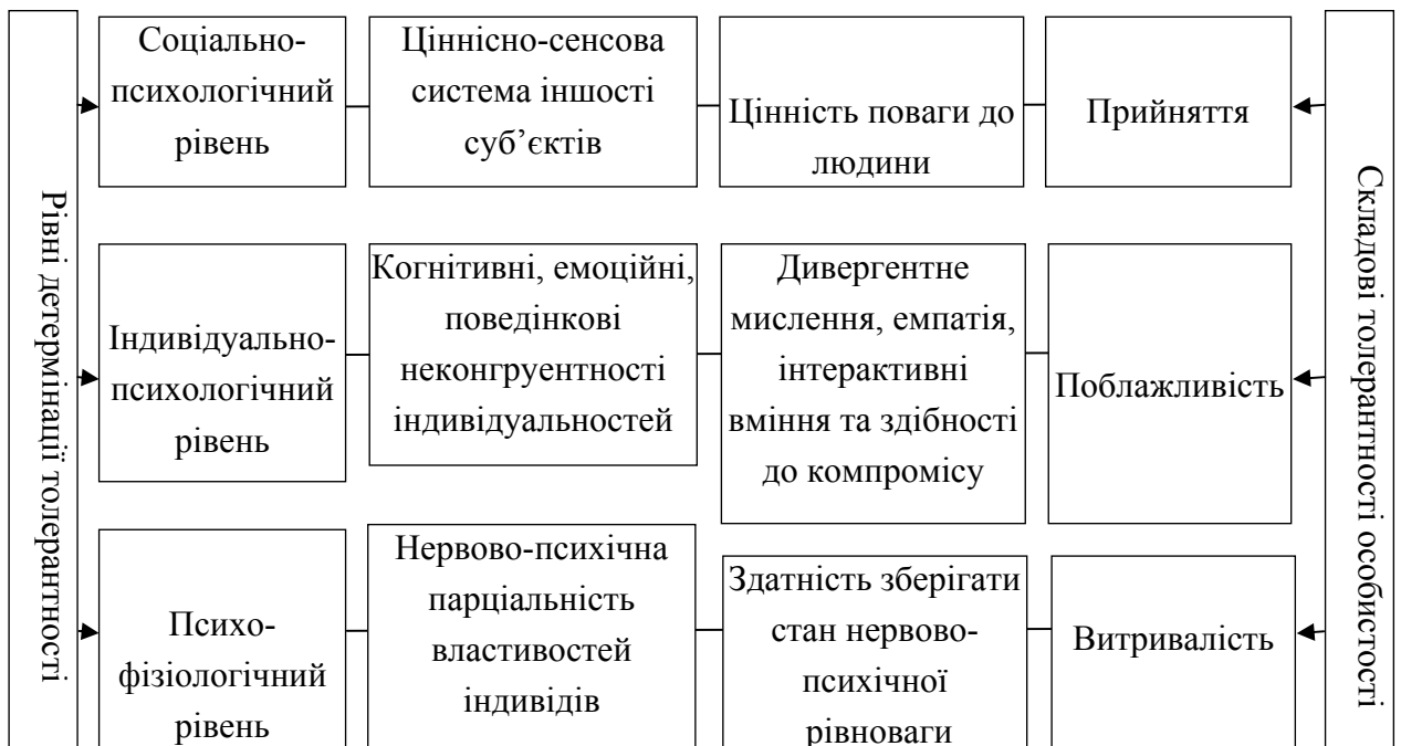
Рис. 1.1. Теоретична модель рівнів детермінації толерантності та її структурних елементів