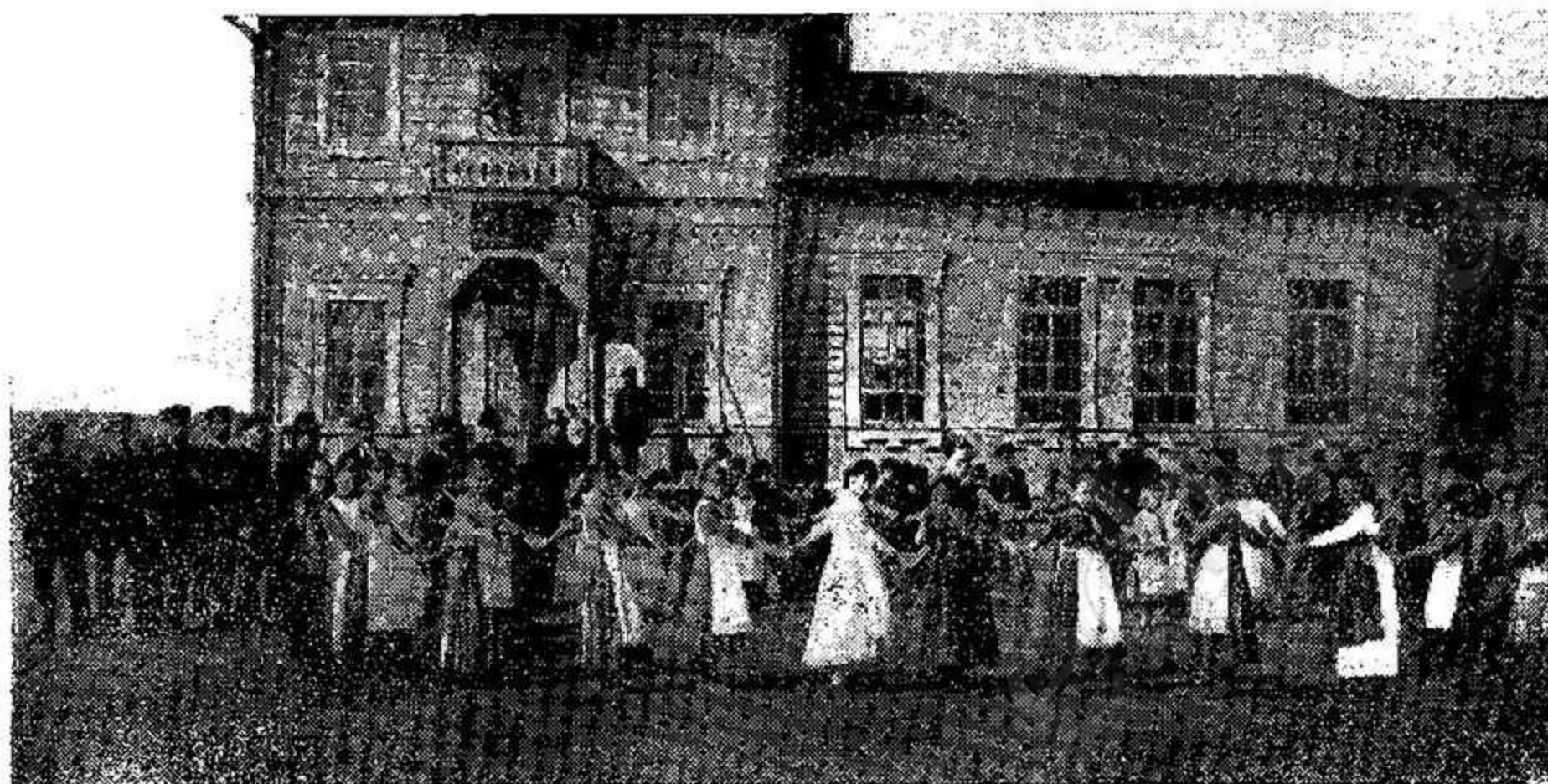
Школа, где учился А. С. Макаренко.