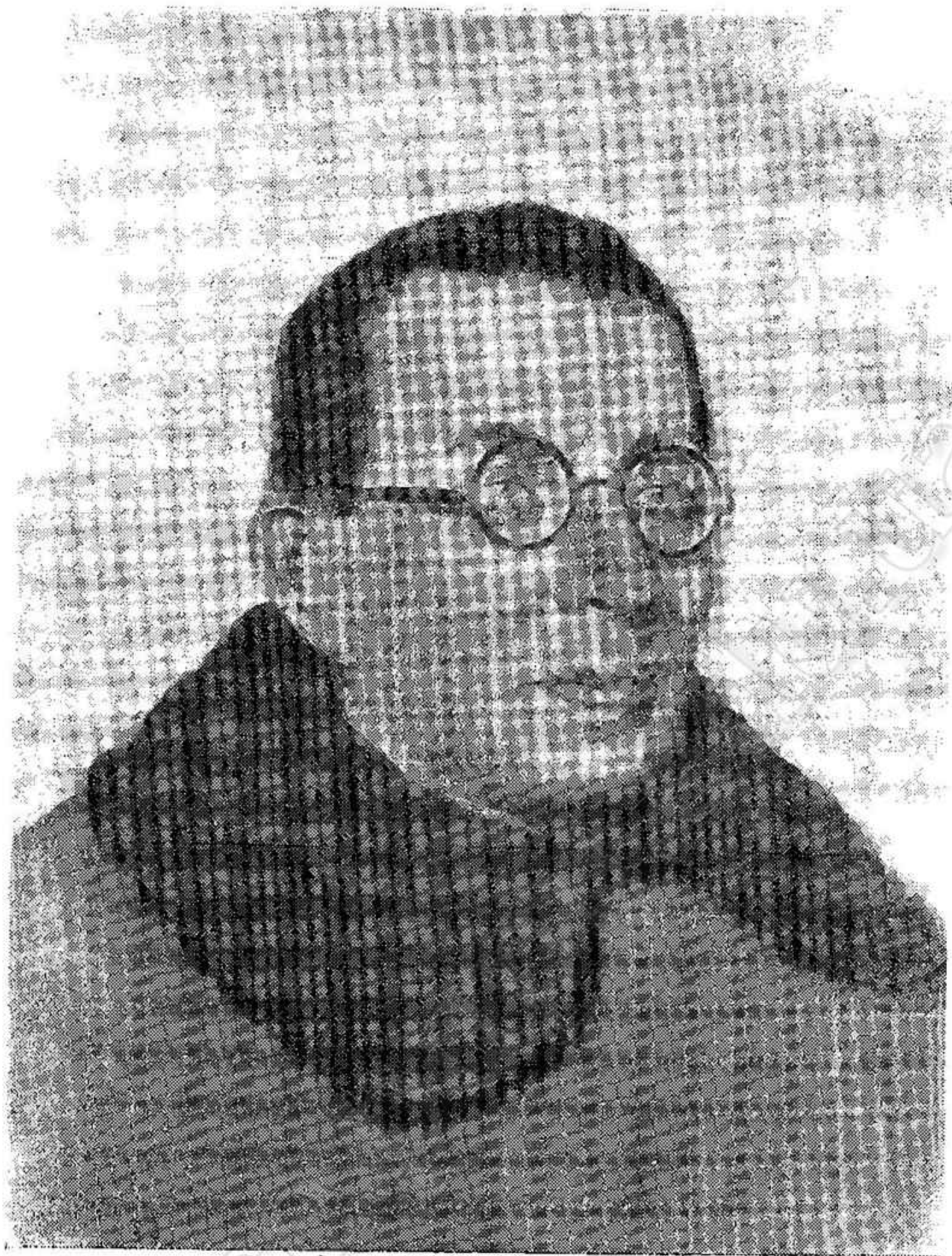
А. С. Макаренко.