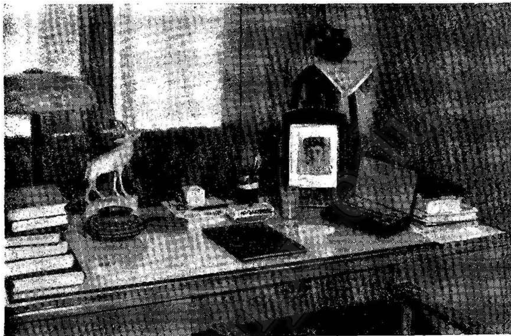
Письменный стол, за которым работал Антон Семенович.

В большинстве случаев личное влияние (педагогическое) Антона Семеновича выражалось не в разговорах или нотациях. Он не вел продолжительных бесед, а остроумной, точно вскользь брошенной фразой добивался изумительных результатов. Эти качества Антона Семеновича внушали нам уверенность, что в его лице мы имели исключительного человека, блестящего организатора и руководителя, создавшего такую четкую систему, такую научную методику, освоив которую, люди,