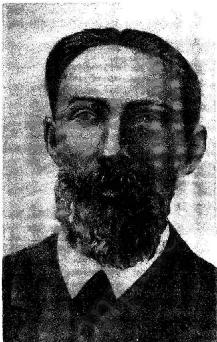
Семён Григорьевич Макаренко (1850—1916)