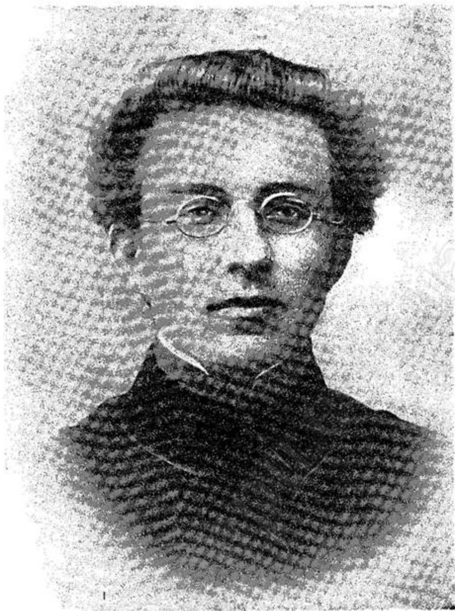
Антон Семёнович Макаренко (фотография 1907 года)