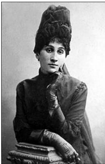
Марія Заньковецька (1854–1934) – українська актриса, театральна діячка, народна артистка УРСР

У другому числі журналу читаємо, що «ушанування Марії Заньковецької» завдяки невтомним зусиллям Марії Петрівни Старицької, акторки, режисерки, дочки українського письменника, театрального й культурного діяча Михайла Петровича Старицького та акторки-аматорки, громадської діячки, сестри українського композитора Миколи Віталійовича Лисенка Софії Віталіївни Старицької (Лисенко), відбулося на високому рівні. Це дійство, наголошують автори редакційної статті, з’явилося серед тих темних хмар, що оповили Україну, стало ясним просвітком, тією величною годиною,