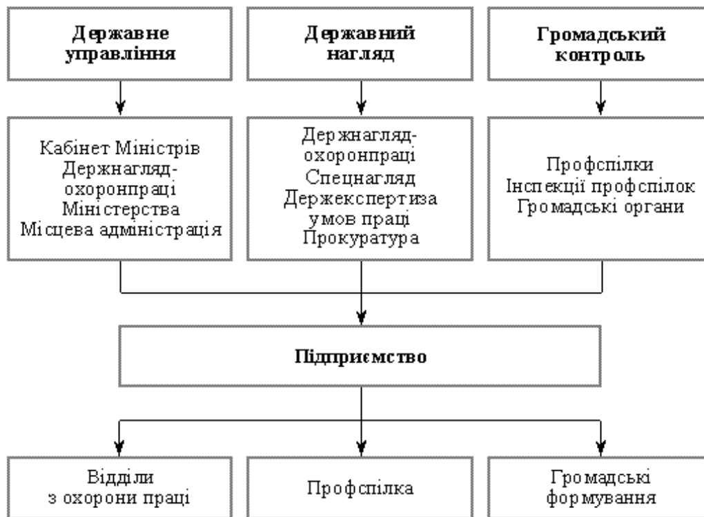
Рис. 1. Органи, які здійснюють управління, нагляд і контроль за станом умов праці та охорони праці

Посадові особи органів державного нагляду за охороною праці несуть відповідальність за виконання покладених на них обов'язків згідно з законодавством.