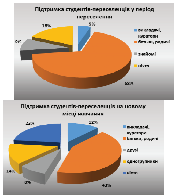
Рис.1. Джерела підтримки студентів-переселенців у період переселення та на новому місці навчання

Під час індивідуальних інтерв'ю студенти зазначили, що потребують порад в організації навчання та побуту, психологічної підтримки, спілкування та позитивного ставлення, прояву інтересу до їхніх потреб і проблем з боку адміністрації, викладачів, одногрупників, студентського активу навчального закладу, проте розраховують переважно на близьких та родичів (див. рис. 1).