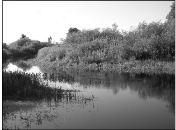
Тихолининна річка Удай. Фото. 2016 р.

літнього взуття з липової кори, тобто лика. Таке взуття й мало назву личаки, або ходаки, бо в ньому легко було ходити. Словники української мови подають однокореневі слова: хідник – доріжка; хідка – стежка. Аналогічно могло виникнути й слово хід-