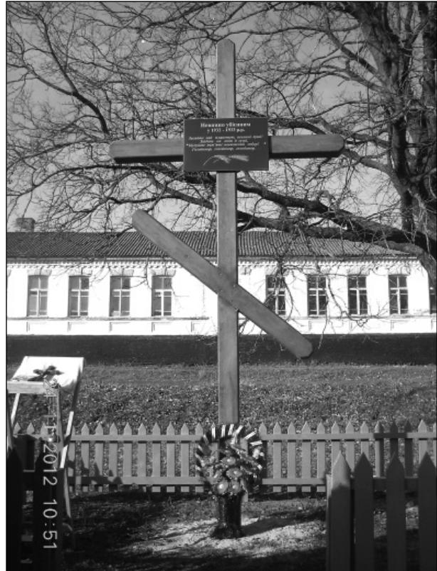
Пам'ятний знак жертвам голодомору 1932–1933 років – жителям с. Хитців Лубенського району Полтавської області. Фото. 2016 р.

Словом, трагедія, спричинена голодом, значно більша, ніж говорять про це зараз, і наслідки її відчуватимуться ще довго. Нині багато хто зі старших