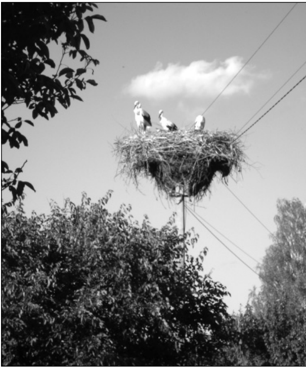
Сільський оберіг. Фото. 2016 р.

вирішено: посилити контроль з охорони лісів, винних притягати до судової відповідальності, а бригадирам заборонити виділяти підводи для поїздки в ліс без дозволу правління і лісників. Це йшлося