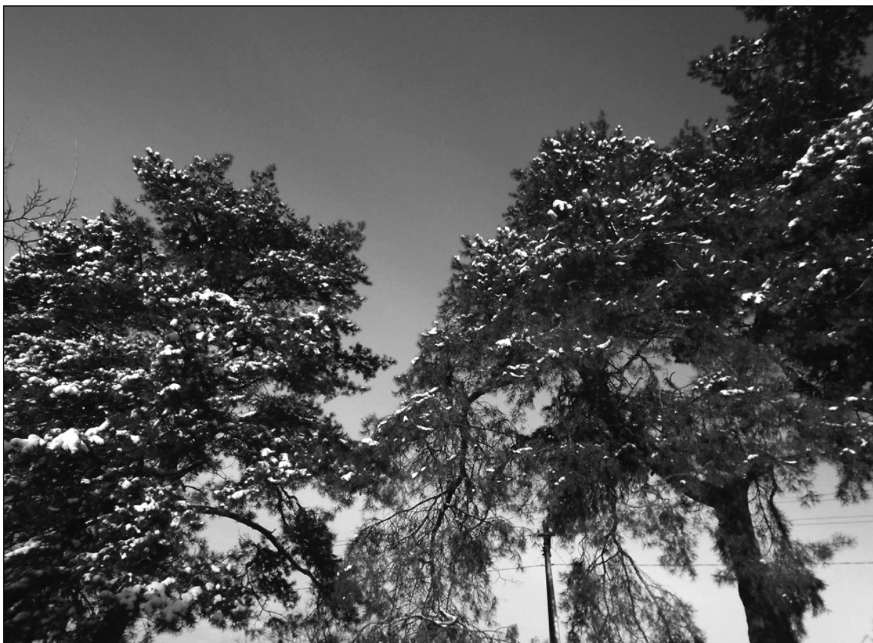
Тютюнникові сосни. Фото, с. Шилівка, 5 грудня 2016 р.

го саду» є основним нашим науковим посібником. І ось несподіванка – із книгою «„Усе живе – тепле“. Нове про Григора Тютюнника» Олександр Шугай з’явився на Тютюнниківських читаннях.