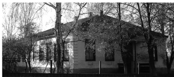
Будівля колишньої Шилівської школи

Тому звертаємося до керівництва Національної спілки письменників України із пропозицією створити Комісію із творчої спадщини Григора Тютюнника та подбати про достойне увічнення його пам'яті.