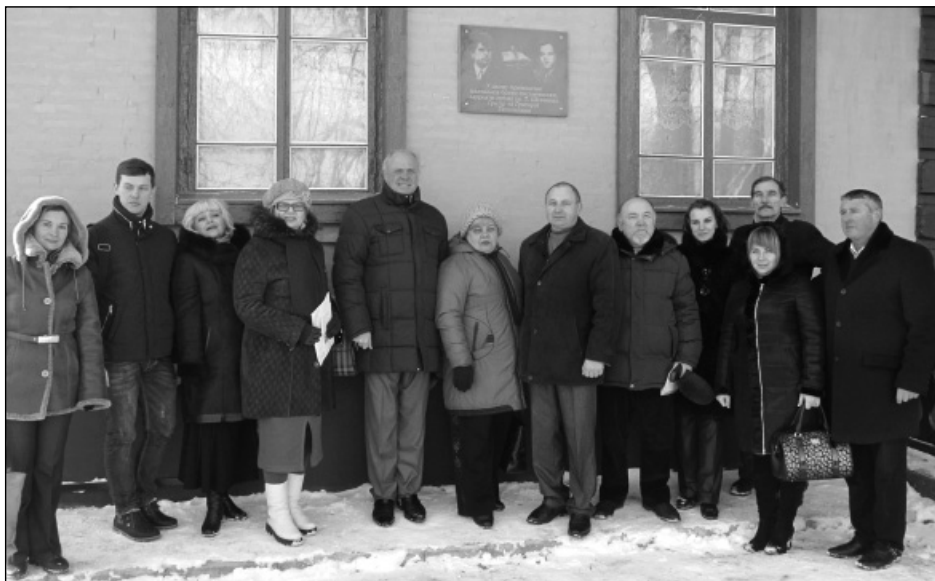
Учасники Всеукраїнських Тютюнниківських літературно-наукових читань. Фото, с. Шилівка, 5 грудня 2016 р.