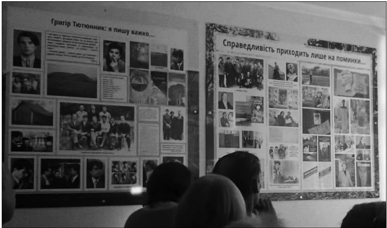
Фрагмент оновленої експозиції літературного музею братів Тютюнників у школі в с. Шилівці. Фото, 5.12.2016 р.

Відомо, що ідея літературно-наукових читань належить багаторічному дослідникові життєпису і творчості братів Тютюнників доктору філо-