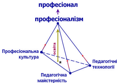
Рис. 1. Гармонійний розвиток учителя-професіонала

Саме такий учитель-професіонал, який володіє професіональною культурою, педагогічною майстерністю та інноваційними педагогічними технологіями, здатен бути менеджером-фасилітатором, едхократом радісної, успішної, щасливої життєдіяльності кожного учасника освітнього процесу. Отже, щоб навчати дітей, почати треба вчителю із себе, творити Себе за законами Гармонії та Краси, використовуючи формулу щастя (Рис. 2.)