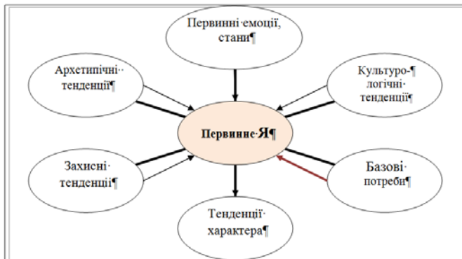
Рис. 1. Первинне Я в структурі природної Базової особистості

Виклад основного матеріалу дослідження. Автор прийшов до висновку, що Я складається з трьох центрів відповідно до трьох основних рівнів особистості [7]. Останні відрізняються за критеріями генотип-середовищної обумовленості компонентів і за ступенем їх сталості, стійкості: 1 – Базовий рівень, або Базова особистість (див. нижче рис. 1), включає визначаються переважно спадковістю освіти (Первинне Я, потреби, тенденції характеру, культурологічні, захисні, архетипічні тенденції, первинні емоції і стану органів тіла); 2 – відносно стійкий рівень, Вторинна особистість (Вторинне Я, мотиви, Я-концепція, цінності і відносини, схильності, звички, звичні емоції); 3 – Оперативно-ситуативний рівень, Оперативна особистість (Оперативне Я, ситуативні самооцінка і рівень домагань, мегаярлики Первинного і вторинного Я, значимі характеристики досвіду, мови, ситуативні цілі, оперативний план, значущі орієнтири середовища).