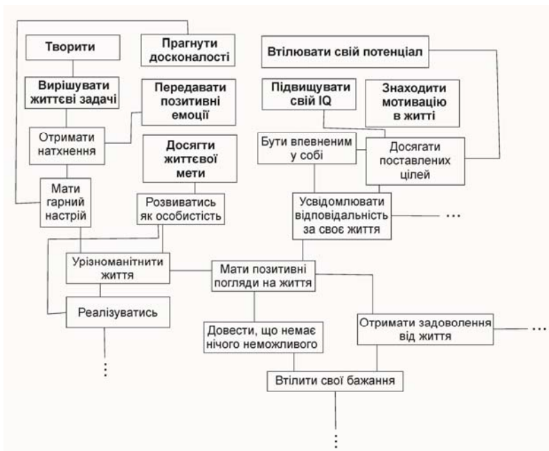
Рис. 3. Фрагмент структури світогляду Р. Б., 25 років (вибірка дорослих)

Відмінності між вибірками юнаків та підлітків при відповіді на питання «Навіщо людина заробляє гроші?» виявилися за кількістю вузлових категорій ( U_{\text{емп.}} = 37,500 ; p = 0,000 ) та індексом зв'язаності ( U_{\text{емп.}} = 88,000 ; p = 0,002 ). Між групою юнаків та групою дорослих існують відмінності за усіма кількісними індикаторами – кількістю граничних ( U_{\text{емп.}} = 89,000 ; p = 0,001 ) та вузлових ( U_{\text{емп.}} = 136,000 ; p = 0,043 ) категорій, індексом зв'язаності ( U_{\text{емп.}} = 125,500 ; p = 0,024 ), середньою довжиною ланцюга ( U_{\text{емп.}} = 115,500 ; p = 0,020 ) та індексом продуктивності ( U_{\text{емп.}} = 81,000 ; p = 0,001 ).