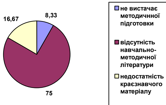
Рис. 1. Результати відповідей на запитання анкети № 6

• при підготовці до екскурсії виникають такі труднощі – 2 вчителі (8,33%) повідомили, що «не вистачає методичної підготовки»; про «відсутність навчально-методичної літератури» повідомили 18 вчителів (75%); про «недостатність краєзнавчого матеріалу» – 4 вчителі (16,67%) (рис. 1).