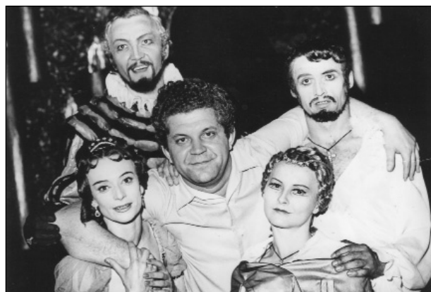
Після вистави балету «Дон Жуан» у Харкові. Виконавці балету з композитором В. Губаренком (у центрі). Фото, 1972 р.

музикознавцем, помічником і палким пропагандистом музики Губаренка. Працювати композитор почав ще під час навчання: акомпаніатором самодіяльного хору, викладачем сольфеджіо у дитячій музичній школі, музичним редактором обласного радіо, а через рік після завершення освіти – викладачем кафедр теорії музики та композиції Харківської консерваторії та одночасно – музичного училища. 1972 року зробив неочікуваний крок: припинив викладацьку діяльність, що розпочалася досить удало, і повністю присвятив себе творчій роботі. Зараз це сприймається як абсолютна переконаність у правильності обраного шляху і власних творчих можливостях. На той час у його доробку