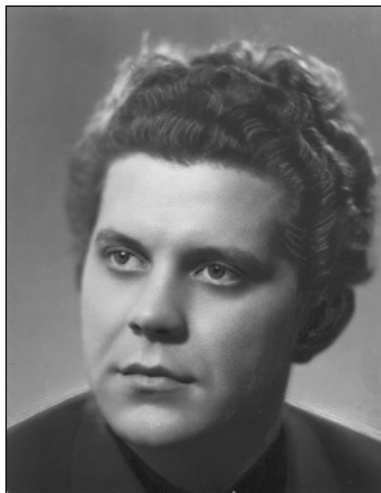
Український композитор Віталій Губаренко. Фото, 1960-ті рр.

На початку 1960-х років до цієї багатозвучної партитури долучився голос молодого композитора Віталія Губаренка. Він став відомим ще за життя численними прем'єрами своїх творів. Вони були написані сучасною музичною мовою, несли активну і напружену експресію, відзначалися пошуком нестандартних драматургічних рішень. Понад сорок років діяльності В. Губаренка збагатили українську музику не тільки новими репертуарними творами, а й новими жанрами, сюжетами, образами. У спадщині композитора марно шукати інструментальні мініатюри, імпровізації чи ескізи. За складом мислення і творчим спрямуванням він був драматургом і симфоністом: оперував глобальними ідеями, що потребували великих форм, і завжди доводив їх до логічного завершення – прем'єри. Серед жанрових уподобань композитора – опера і ораторія, балет і симфонія, концертні твори для сольних інструментів у супроводі оркестру, музика до кінофільмів та театральних спектаклів, кілька вокальних циклів. Але усталені класичні форми були